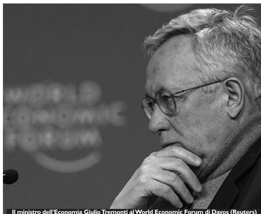
Il ministro dell'Economia Giulio Tremonti al World Economic Forum di Davos

senza costare ai cittadini». Ma il momento più intenso del secondo giorno del vertice di Davos è stato l'intervento di Jamie Dimon, amministratore delegato di Jp Morgan, che ha strappato ripetuti applausi alla platea chiedendo ai politici statunitensi di «parlare meno della dannata nazionalizzazione delle banche» e di «darsi una mossa» con un piano definito e credibile contro la crisi. L'Opec ha scelto la platea svizzera per annunciare di essere pronta a nuovi sostanziosi tagli alla produzione del greggio (anche di 4,2 milioni di barili ha detto il segretario del cartello Abdullah al-Badri) per riportare il petrolio a 60-80 dollari dai 40 attuali. Le barile attorno ai 50 dollari, ha concluso al-Badri, non sarebbe sufficiente a garantire gli investimenti necessari. Mentre dopo la critica rivolta martedì agli Usa da parte di Russia e Cina, ieri l'India ha deplorato il neo-protezionismo occidentale. Kamal Nath, ministro del Commercio indiano, ha segnalato «il crescente impiego di misure anti-dumping in Occidente». Se le cose non cambieranno «l'India sarà costretta a fare protezionismo a sua volta - ha minacciato Nath - e non sarà un bene per nessuno».