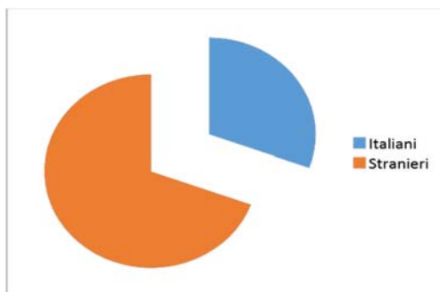
Grafico 1: fruitori dei centri Caritas divisi tra italiani e stranieri