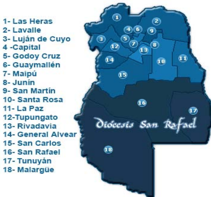
Mappa dell'Arcidiocesi di Mendoza

Per la localizzazione cfr cartina di seguito n.5.