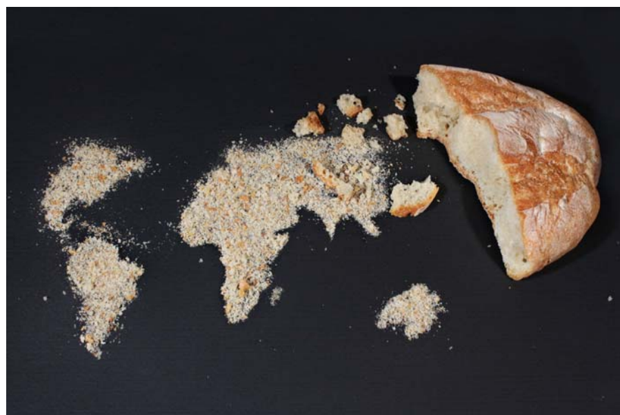
“MANGIA MONDO” - Gianmarco GIOMBETTI classe III sez. B - Istituto tecnico grafica e comunicazione “Seneca” – Fano (PU)