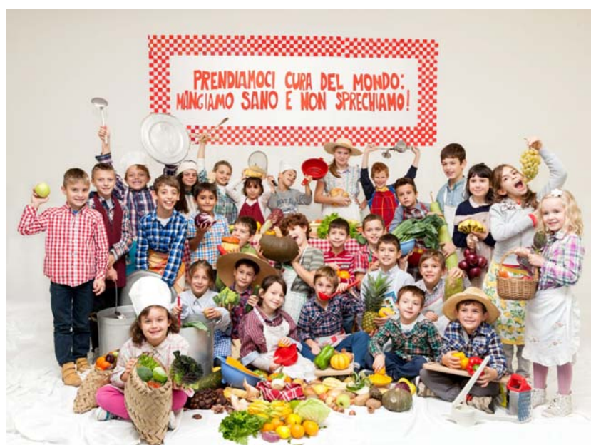
“PRENDIAMOCI CURA DEL MONDO, MANGIAMO SANO E NON SPRECHIAMO” – classe V sezione unica Scuola primaria Pietro Caliarì - Verona